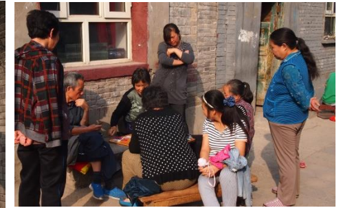
家の前でカードゲームを楽しむ住民たち