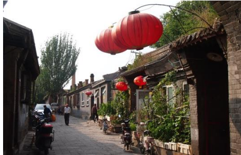
煉瓦でつくられた家々が立ち並ぶ