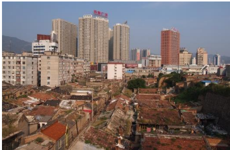
市街地の中に残る旧市街の街並み

この張家口には、中心街の中に一部取り残されたように旧市街や城壁が残っていて、土と石と瓦で作られた昔ながらの中国の古い街並み、静かで素朴な人々の生活を今でも感じることができます。この場所にくると、一気に何十年もタイムスリップをして、昔の中国にいるような感覚になるかもしれません。この旧市街は文化保護区としての指定を受けていますが、老朽化も進んでいて、人が居住することも難しくなっているため、この先保護を続けていくのか、それとも新しい街として生まれ変わるのか、その先行きが決まるのもそう遠くない未来ではないかと思われる。